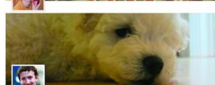
上の2つは、カバー写真とプロフィールアイコンを組み合わせてデザインされています！